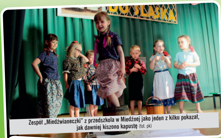
Zespół „Miedzwianeczki” z przedszkola w Miedźnej jako jeden z kilku pokazał, jak dawniej kiszono kapustę

W dniach 15-16 maja w Woli odbył się XXI Festiwal Folklorystyczny Dorosłych, XX Festiwal Dzieci i Młodzieży oraz VII Parada Ludowego Stroju Śląskiego „Jak Cie widzóm, tak Cie piszóm”. Młodszy i starsi artyści pokazali, jak należy pielęgnować śląskie wartości