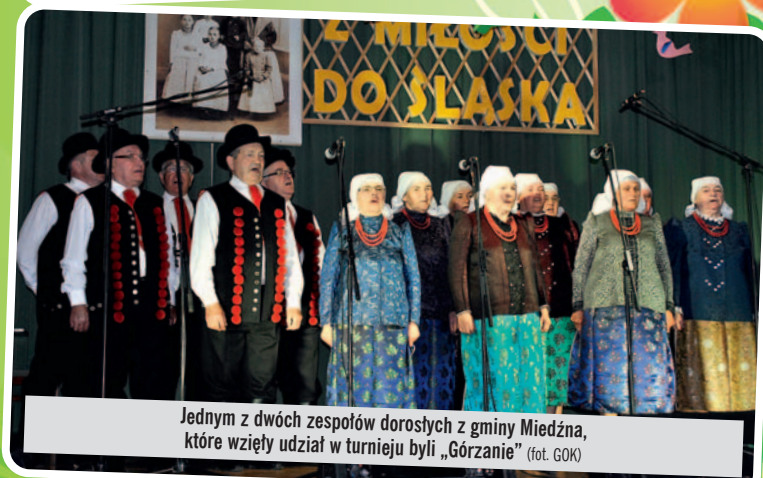
Jednym z dwóch zespołów dorosłych z gminy Miedźna, które wzięły udział w turnieju byli „Górzanie”