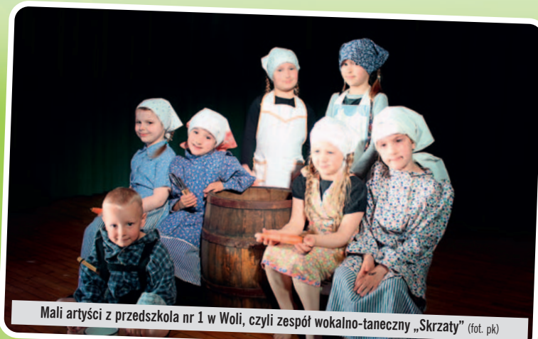
Mali artyści z przedszkola nr 1 w Woli, czyli zespół wokalo-taneczny „Skrzaty”