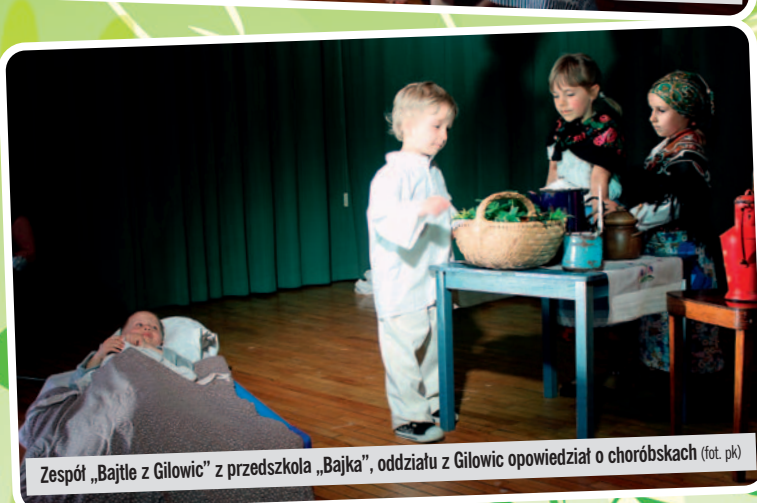
Zespół „Bajtle z Gilowic” z przedszkola „Bajka”, oddziału z Gilowic opowiedział o choróbskach