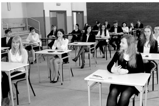
Uczniowie LO w Gilowicach przed pisemnym egzaminem z matematyki

W gilowickim liceum wśród przedmiotów dodatkowych największym powodzeniem cieszyły się biologia, geografia i chemia. W Zespole Szkół Zawodowych i Ogólnokształcą-