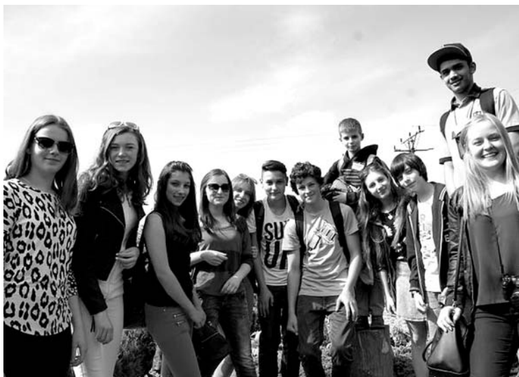
Goście z zagranicy odwiedzili m.in. Pszczynę i Kraków