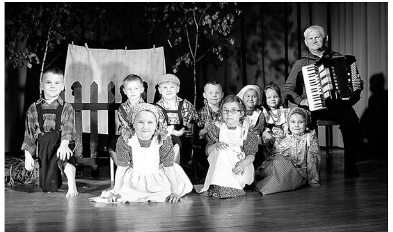
Wśród przedszkolaków najlepszy okazał się Zespół Pieśni i Tańca „Knefliki” z Przedszkola nr 2 im. Wandy Chotomskiej w Woli.