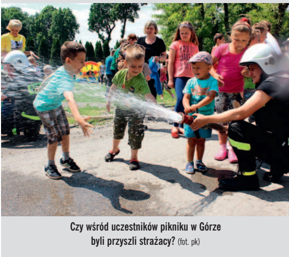
Czy wśród uczestników pikniku w Górze byli przyszli strażacy?