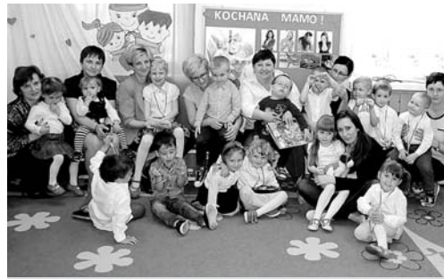
Dzieci przygotowały niespodzianki dla swoich mam

26 maja świętowaliśmy Dzień Matki. W szkołach i przedszkolach przygotowano przedstawienia dla mam. 27 maja do przedszkola swoje mamy zaprosiły dzieci z Punktu Przedszkolnego Gminnego Publicznego Przedszkola im. Marii Kownackiej w Miedźnej. Na początek przygotowano zajęcia otwarte. Pszczółki zaprezentowały swoje zdolności w specjalnie przygotowanym na tę okazję programie artystycznym. Śpiewały piosenki, recytowały wiersze oraz tańczyły dla swoich mam. Nie zabrakło składania życzeń oraz wręczania własnoręcznie zdobionych upominków. Przedszkolaki pochwalili się również osiągnięciami zdobytymi z języka angielskiego. Wszyscy zostali zaproszeni na słodki poczęstunek. Dalsza część uroczystości przebiegała na wspólnej zaba-