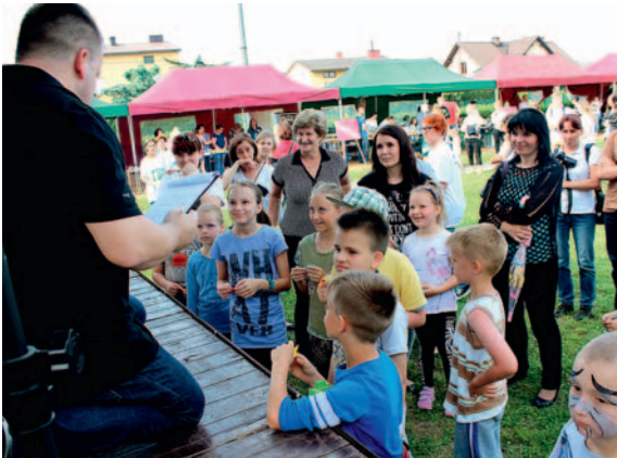
W konkursie babeczkowym w Woli można było wygrać ciekawe nagrody