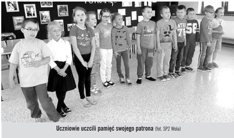
Uczniowie uczcili pamięć swojego patrona

Wśród klas starszych zwyciężyła klasa IVa. Następne miejsca zdobyły klasy: VIb, VIa, IVb, V. SP2 Wola