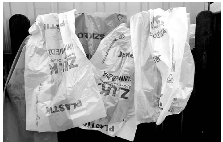
Odbiór odpadów zielonych należy wcześniej zgłosić

Zgłoszenia odbioru przyjmowane będą pod numerami tel.: 33 842 32 80 lub 33 842 30 97, e-mail: odpady.zielone@zuk.oświecim.pl. Odpady zielone należy wystawić w zawiązanych workach przed posejście do godziny 7.00 w dniu odbioru w miejscu umożliwiającym dojazd samochodem ciężarowym. UG