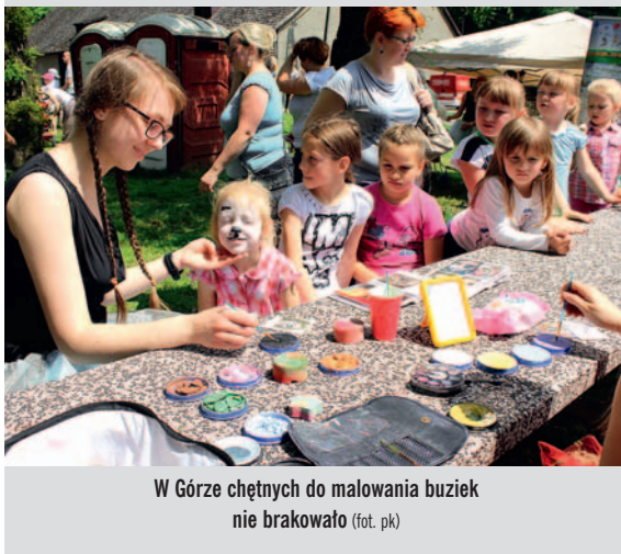
W Górze chętnych do malowania buziek nie brakowało