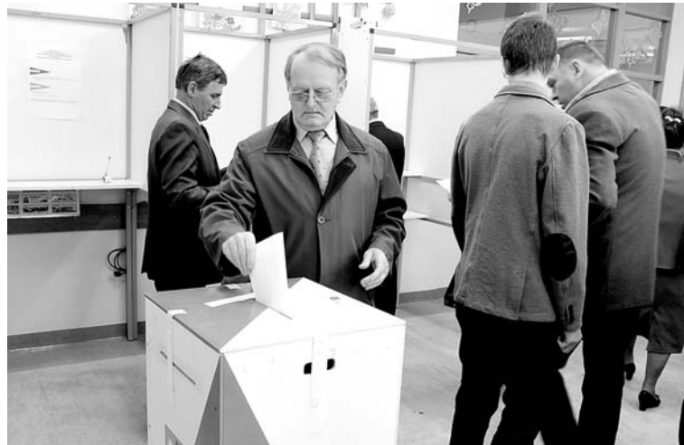
Zarówno w pierwszej, jak i w drugiej turze mieszkańcy gminy Miedźna najchętniej głosowali na Andrzeja Dudę

Dwa tygodnie później w drugiej turze zmierzali się kandydat PiS oraz urzędujący prezydent. Do urn poszło więcej niż w pierwszej turze mieszkańców gminy Miedźna, bo 7 303, co dało frekwencję na poziomie 59,26%. Znów najbardziej zmobilizowali się mieszkańcy sołectwa Wola