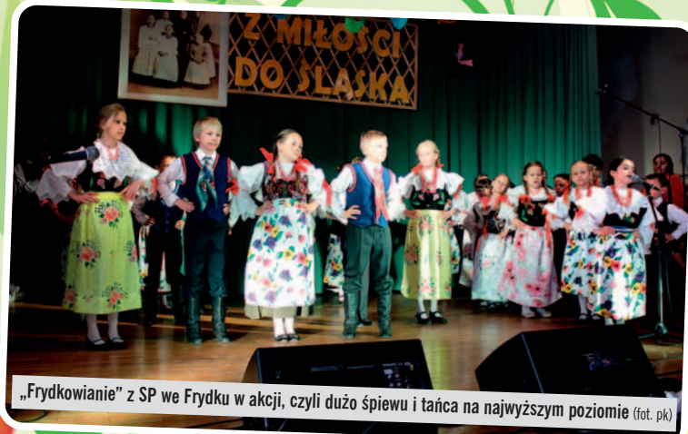
„Frydkowianie” z SP we Frydku w akcji, czyli dużo śpiewu i tańca na najwyższym poziomie