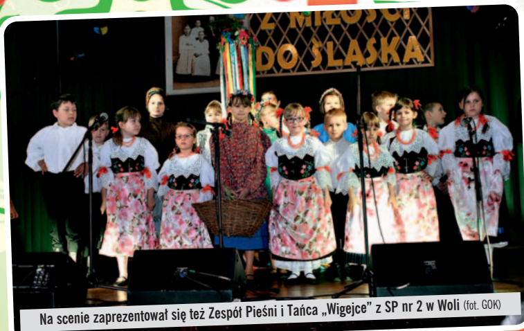
Na scenie zaprezentował się też Zespół Pieśni i Tańca „Wigejce” z SP nr 2 w Woli