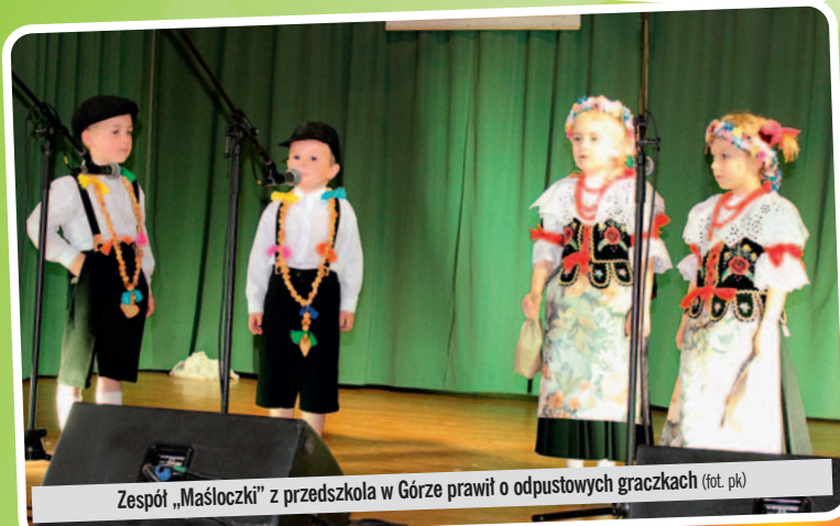
Zespół „Maślóczki” z przedszkola w Górze prawił o odpustowych graczkach