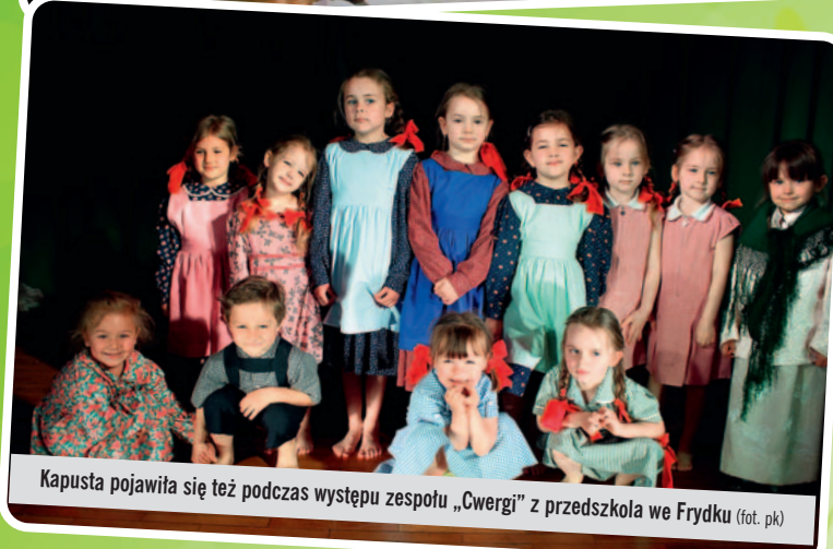
Kapusta pojawiła się też podczas występu zespołu „Cwergi” z przedszkola we Frydku