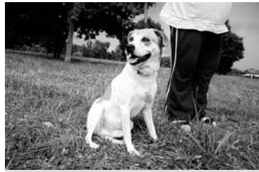
Pies, którego wirtualnie adoptowali uczniowie z Woli

20 maja na zebraniu Samorządu Uczniowskiego uczniowie wybrali psa do adopcji z Ogólnopolskiego Towarzystwa Ochrony Zwierząt Animals z oddziału oświęcimskiego. Zaadoptowali wirtualnie pieska o imieniu Frodo za pieniądze zbierane z akcji „Zdro-