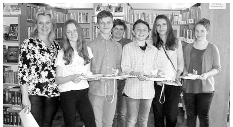
Pierwsze miejsce zajęli też gimnazjaliści z Miedźnej