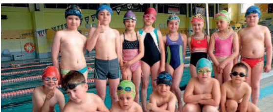
W imprezie wzięło udział 336 zawodników