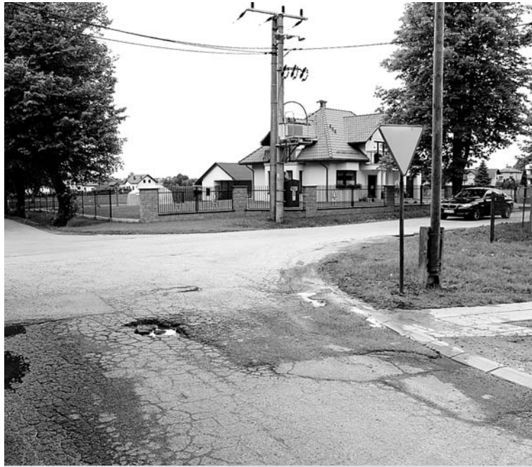
Czy w ramach schetynówek uda się przebudować drogę przy przedszkolu w Górze?