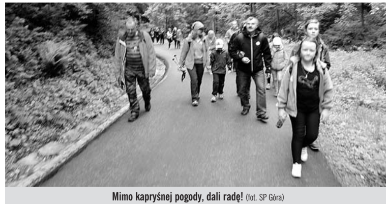
Mimo kapryśnej pogody, dali radę!

23 maja Szkoła Podstawowa im. Janusza Korczaka w Górze zorganizowała I Szkolny Rajd Górski. Uczestnicy mieli do wyboru trzy trasy – łatwą, średnią i trudną. Mogli przejść szlakiem niebieskim z Czernichowa, szlakiem zielonym z Wilkowic lub szlakiem czerwonym z Bielska. Cel był jeden – dotarcie do schroniska na Ma-