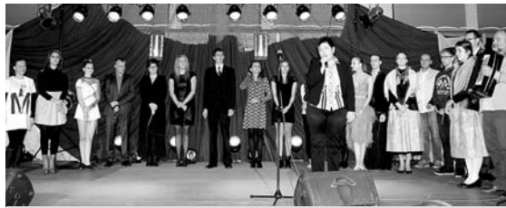
27 grudnia ub.r. zorganizowano jubileuszową uroczystość. Obchody 20-lecia liceum zakończy nadanie imienia prof. Religi